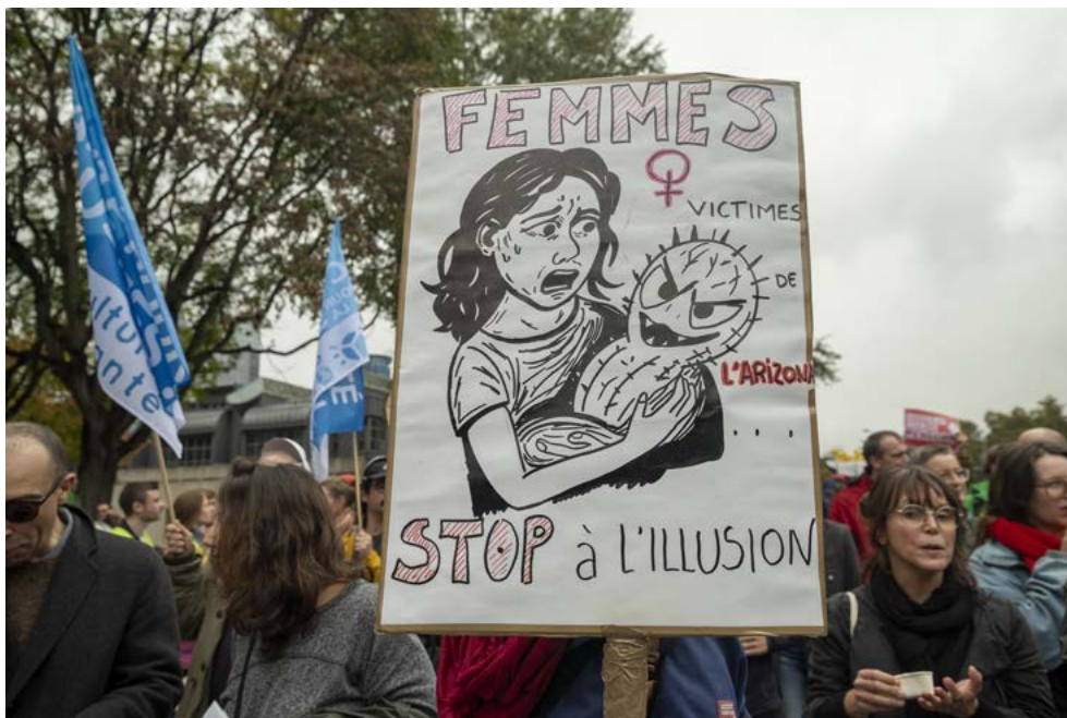
Photo : Matthias Förster, Manifestation contre les mesures du gouvernement Arizona, 14 octobre 2025, Bruxelles.

spécialisation et à la profession (limitation de la possibilité d'obtenir un numéro INAMI 1 ). Diverses études ont montré une sous-estimation du nombre de médecins fixés par cette planification 2 . Cependant, la réponse des responsables politiques, fondée sur des études managériales, vise à nier cette pénurie (qu'ils planifient) en soutenant que le problème n'est pas lié au nombre de professionnels, mais à l'organisation du travail. Il faudrait, selon ce raisonnement, tendre à une « meilleure répartition des tâches », une pratique dite du skill mix dans la novlangue managériale. Justifié par le besoin de réduction des coûts, le skill mix peut prendre quatre formes : « le renforcement des qualifications » (en élargissant le champ d'action d'un groupe de professionnels par le biais de la formation) ; « la substitution » (en gommant les barrières des fonctions professionnelles et/ou en échangeant un-e