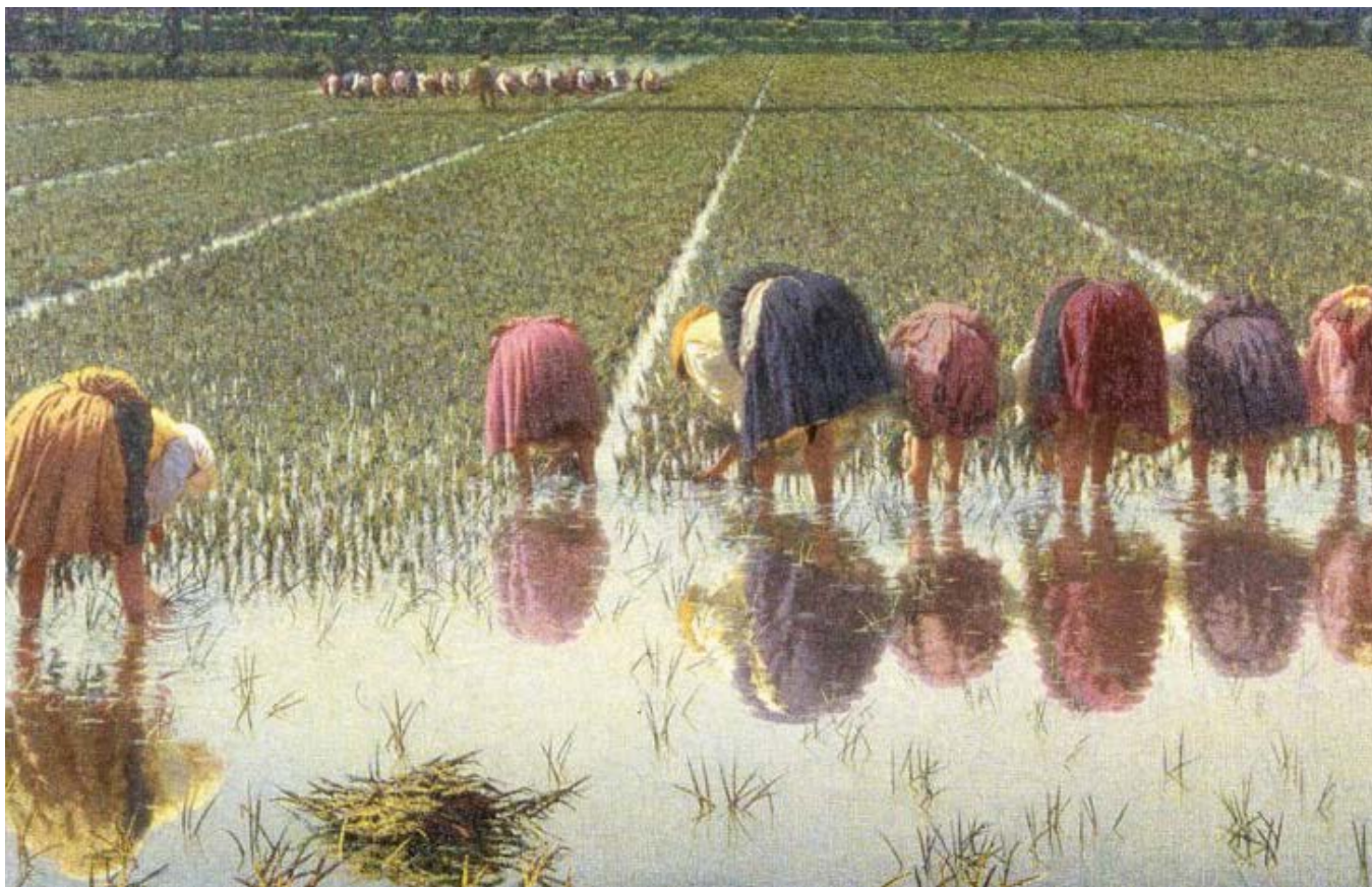
Illustration : Angelo Morbelli, Per ottanta centesimi, olio su tela (1895-1897), Museo Borgogna (Vercelli)

l'urgence de la reconstruction d'après-guerre. Celle-ci est rendue difficile par les luttes ouvrières contre le travail salarié et par les luttes des femmes, tant à l'intérieur qu'à l'extérieur des foyers.