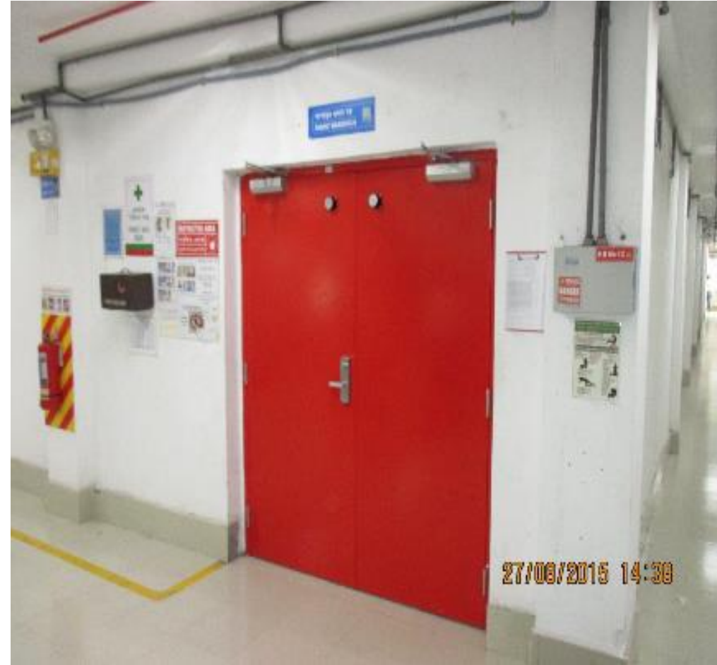
Après: porte coupe-feu