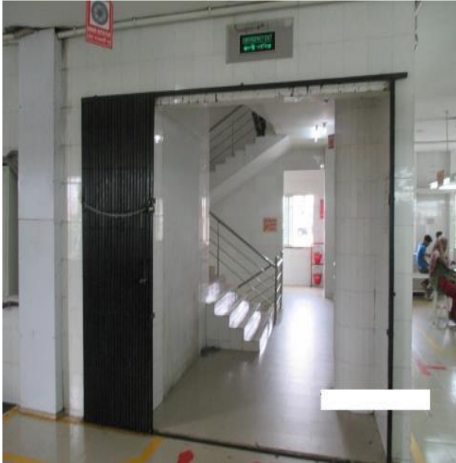
Avant: porte coulissante