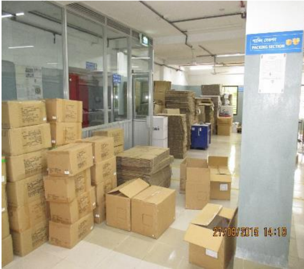
Avant: pas de séparation